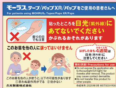
おくり手帳用付箋

文献請求先及び問い合わせ先 久光製薬株式会社 お客様相談室 〒135-6008 東京都江東区豊洲三丁目3番3号 TEL.0120-381332 FAX.(03)5293-1723 受付時間/9:00-17:50(土日・祝日・会社休日を除く)